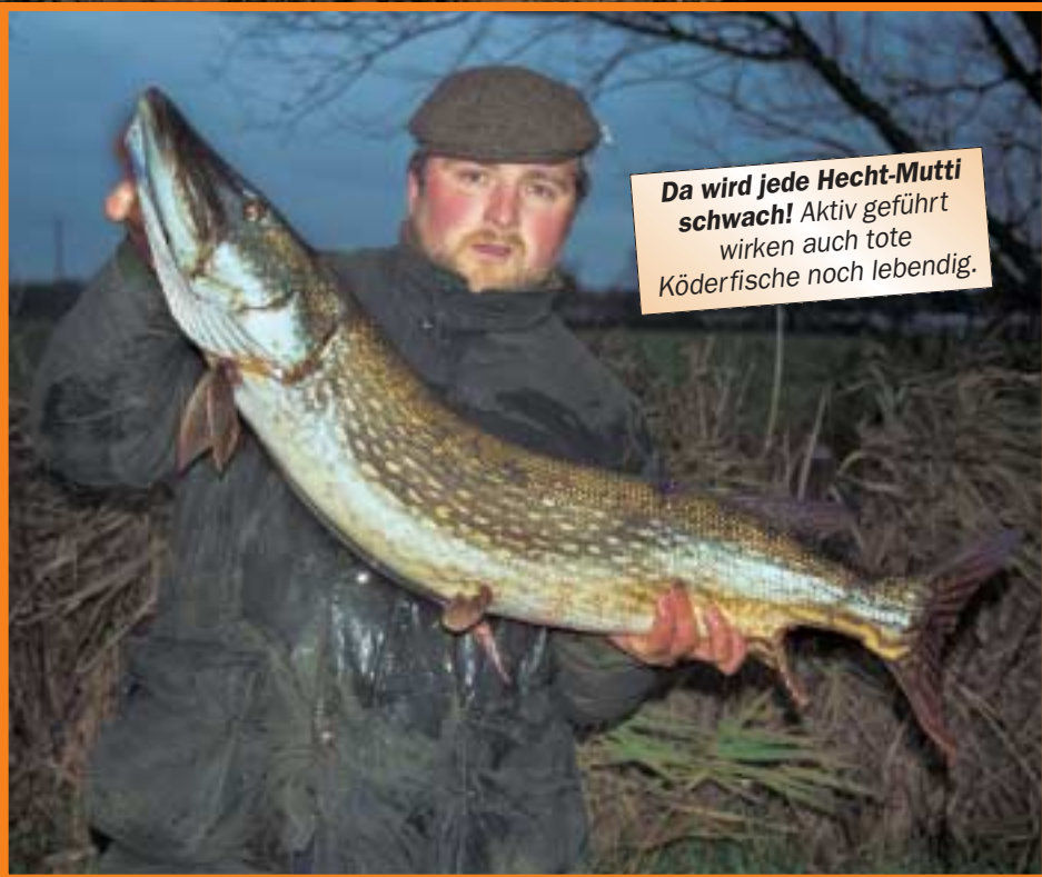
Da wird jede Hecht-Mutti schwach! Aktiv geführt wirken auch tote Köderfische noch lebendig.