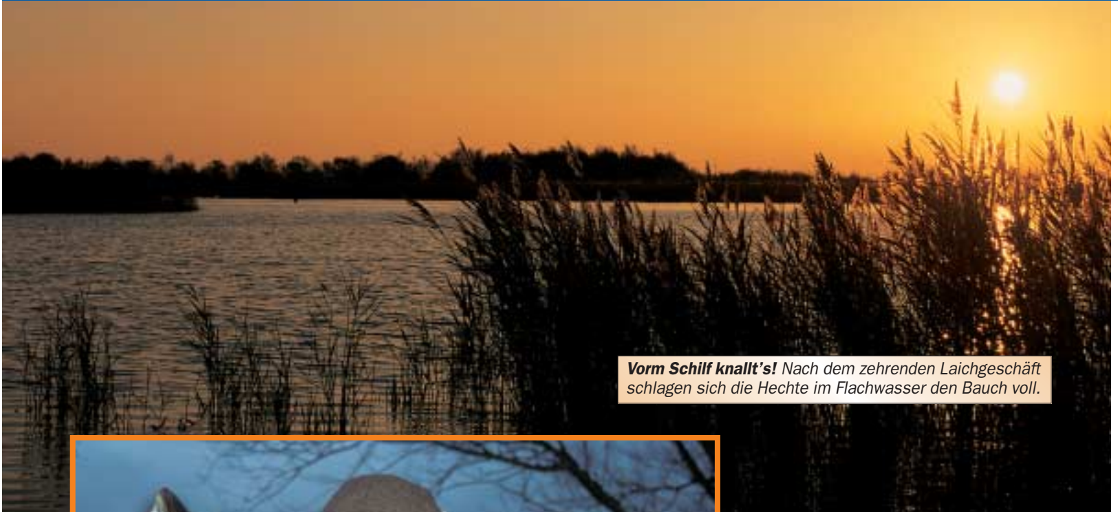
Vorm Schilf knallt's! Nach dem zehrenden Laichgeschäft schlagen sich die Hechte im Flachwasser den Bauch voll.