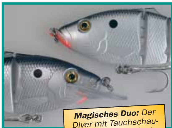
Magisches Duo: Der Diver mit Tauchschaufel für Still-, der Floater für Fließgewässer.

sich für das Outfit mit dem Sie auflaufen?