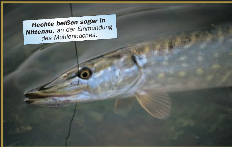
Hechte beißen sogar in Nittenau, an der Einmündung des Mühlengrabens.

Um die Zukunft der Welse im Regen braucht man sich nach meiner Meinung keine Sorgen machen. Immer wieder beißen kleinere Exemplare, selbst am Nachmittag, auf Würmer. So konnte ich in meinem letzten Urlaub ein knapp 70 cm langes Exemplar beim Feederangeln auf Barben landen. Der Untermaßige biss auf 2 kleine Rotwürmer.