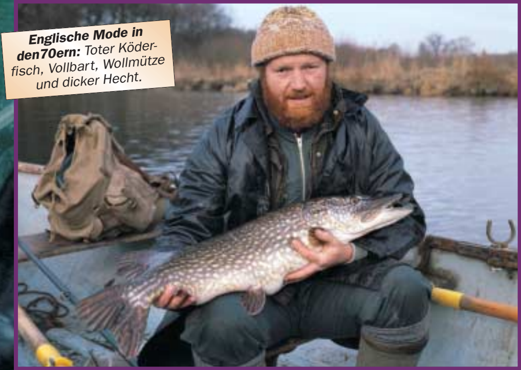
Englische Mode in den 70ern: Toter Köderfisch, Vollbart, Wollmütze und dicker Hecht.