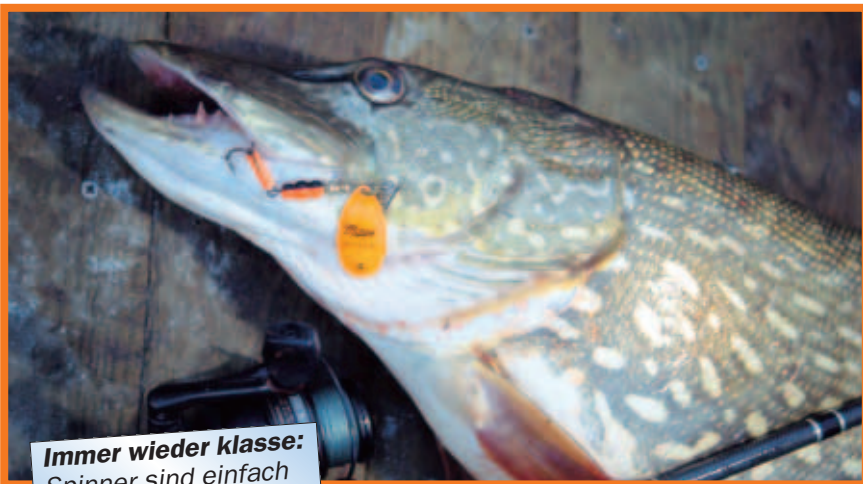
Immer wieder klasse: Spinner sind einfach gute Raubfischköder.