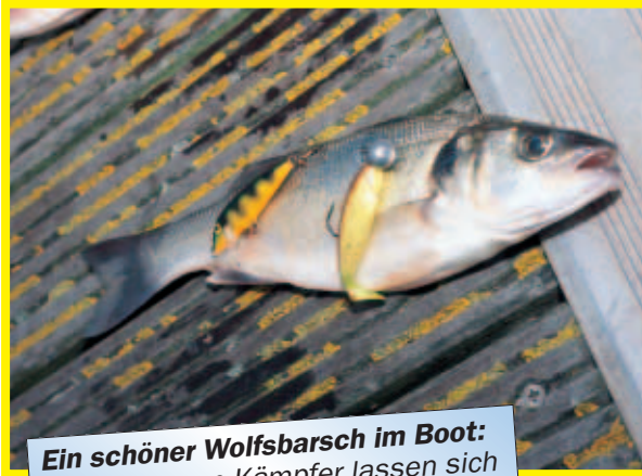
Ein schöner Wolfsbarsch im Boot: Die strammen Kämpfer lassen sich auch mit der Spinnrute überlisten.

Die Fliegenrute habe ich dann allerdings am zweiten Tag zur Seite gelegt. Es war leider zu heftiger Wind zum Werfen. Doch Not macht ja bekanntlich erfinde-