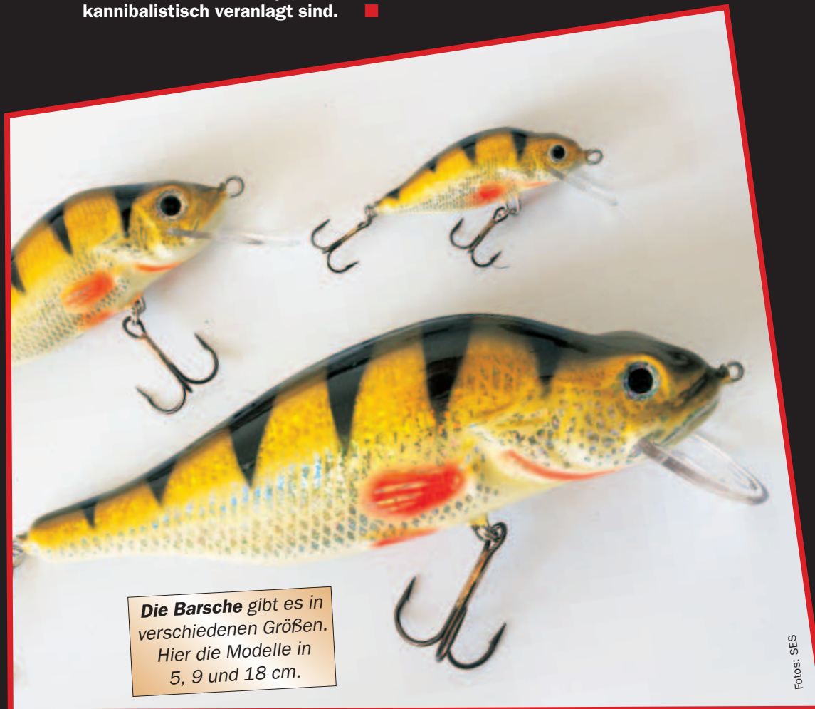
Die Barsche gibt es in verschiedenen Größen. Hier die Modelle in 5, 9 und 18 cm.

**** sehr gut, *** gut, ** mittel, * schlecht