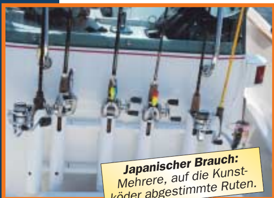
Japanischer Brauch: Mehrere, auf die Kunstköder abgestimmte Ruten.

TAKAHASHI: Es kommt zum einen auf die Liebe zum Detail an, zum anderen muss der Kunstköder natürlich funktional sein. Schaut man sich z. B. die auf dem Markt erhältlichen 2-teiligen Wobbler an, dann hat man fast nur Produkte, die sich sehr schlecht werfen lassen, weil sie in der Luft zu stark flattern. Ganz anders mein 3-teiliger Deka-Hamakuru. Er fliegt sehr gerade, flattert nicht und man kann ihn weit hinaus feuern. Diese guten Flugeigenschaften erreichen wir mit einer Tungstenkugel, die im zweiten Teil des Wobblers liegt. Es sind eben die