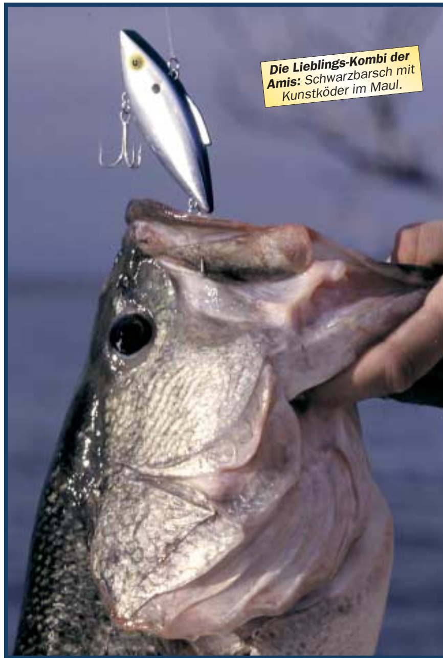
Die Lieblings-Kombi der Amis: Schwarzbarsch mit Kunstköder im Maul.

RAUBFISCH: Welches gesellschaftliche Ansehen genießt das Angeln in den Vereinigten Staaten?