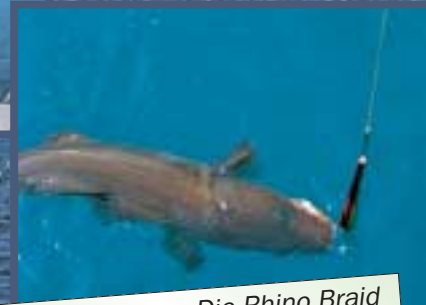
Dorsch-Alarm: Die Rhino Braid machte auch in Norwegen eine gute Figur.

flochtene in Sachen Abriebfestigkeit durchaus sehen lassen kann. Beim Pilken über Muschelgrund dauerte es schon eine ganze Weile, bis die ersten Verschleißerscheinungen auftraten. Ebenfalls bemerkenswert: Die Knoten hielten auch bei Extrembelastungen wie Hängern bombenfest. Dazu trägt sicherlich die nicht zu glatte Schnur-Oberfläche bei.